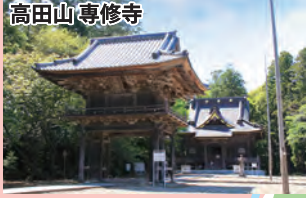
高田山専修寺 浄土真宗の開祖親鸞聖人開山。建造物等多くが国の重要文化財に指定。県指定文化財の涅槃像も見事です。