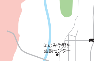
にのみや野外活動センター