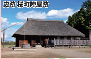
史跡 桜町陣屋跡 二宮尊徳(幼名・金次郎)が桜町領の復興事業を行った役所跡で、国指定史跡となっています。