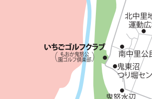
いちごゴルフクラブ ももか農藝公園ゴルフ倶楽部