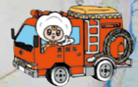
真岡市イメージキャラクター コットベリー