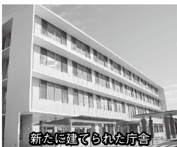
新たに建てられた庁舎