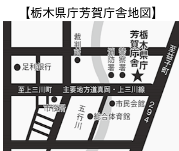
【栃木県庁芳賀庁舎地図】