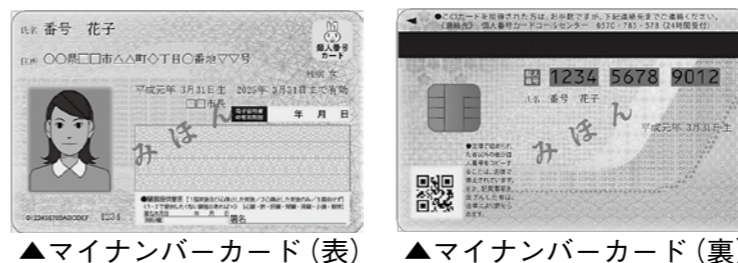
▲マイナンバーカード（表） ▲マイナンバーカード（裏）