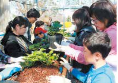
▲いちご苗定植体験の様子

いちごオーナー事業は、道の駅にのみやや、いちご生産者などで組織する「いちごブランドファンづくり協議会」が主催し、生産量・販売額ともに日本一を誇る、本市のいちごのファンづくりを目的として、参加者がオーナーとなり、苗の定植から受粉、摘み取り、加工までの生産工程を体験するものです。11月5日(日)、道の駅にのみやにおいて、事業の第1回目となる「いちご苗定植体験」が開催されました。市内外から参加した36人の方々が、とちおとめや女峰などの苗を定植し、肥料まきや保温のためのフィルム貼りなどの作業を体験しました。今後は、3月まで、苗の受粉作業やいちご摘み、いちご飯作りなどの体験事業が予定されています。