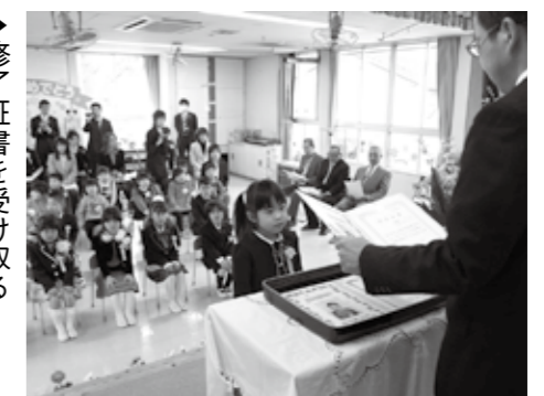
▶修了証書を受け取る最後の子どもたち

3月23日(金)、真岡市立荒町保育所の修了式・閉所式が行われました。 荒町保育所は、昭和50年に開所し、施設の老朽化と施設統合により、37年間の歴史に幕を下ろしました。 閉所まで、延べ千人あまりの子どもたちを小学校へ送り出してきました。当日も、最後の子どもたちが思い出の場所を、元気に巣立っていきました。