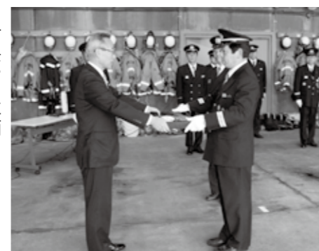
▶市長から車両を引き継ぐ消防団長

3月24日(土)、真岡市消防団の消防ポンプ自動車更新に伴う引渡式が、真岡消防署において行われました。 今回の更新は、第6分団第3部(物部地区)と第7分団第1部(長沼地区)の2車両が更新対象で、市長から団長に、団長から各部へと引き渡され、託された団員は、有事の際に迅速な対応が取れるよう、車両の取扱説明を、真剣な面持ちで聞いていました。