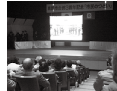
▲「合併3周年の歩み」スライドショー