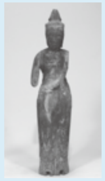
【有形文化財(彫刻)】 木造菩薩形立像一躯(遍照寺所有) 像高62.5cm 髻際高53.2cm 一木造、彫眼、肉身部・着衣部とも古色仕上げ

平成24年3月21日に、新たに二件の文化財が、真岡市指定有形文化財に指定されました。これにより、真岡市指定の文化財は一四三件となりました。