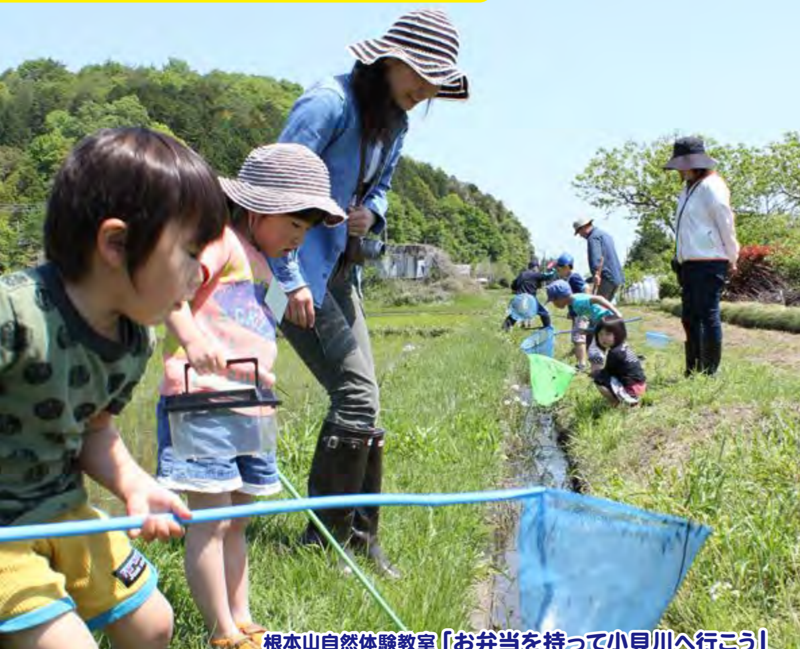
根本山自然体験教室「お弁当を持って小貝川へ行こう」