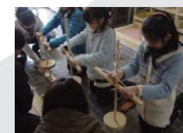
火起こし体験の様子▲

【とき】① 10:00 ~ 11:00 ② 14:00 ~ 15:00 【対象】市内の小中学生と保護者 【申込】各回先着 10組 申込不要 【参加費】無料