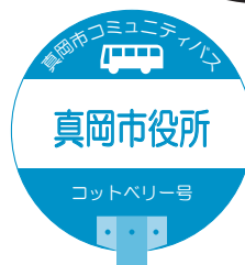
バス停イメージ図