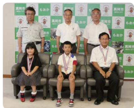
▲受賞者の皆さん、おめでとうございます。