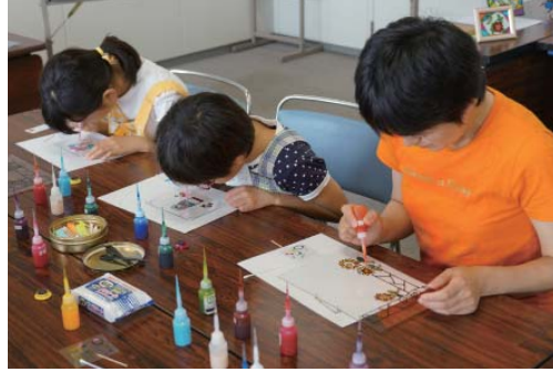
▼8月10日(土) 市民館 二宮分館 市民講座 ディンプルアート体験教室

ペルーやブラジルなど5カ国25人の方が参加し、通訳を介して心肺蘇生の方法やAEDの使い方、気道異物の除去や止血法を学びました。参加者はいざという時のために、講師の話熱心に聞き、真剣な表情で取り組んでいました。