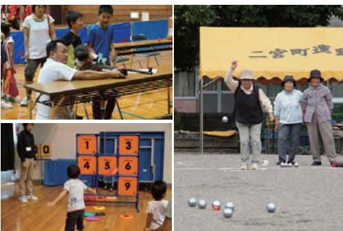
▼9月7日(土) 総合体育館ほか 芳賀地区スポーツ・レクリエーション祭

東日本大震災で大きな被害を受けた、栃木県指定文化財となっている芳全寺所有の阿弥陀如来坐像が移転・修復され、落慶法要と式典が行われました。式典には、多くの関係者の方々が出席し、共に完成を祝いました。