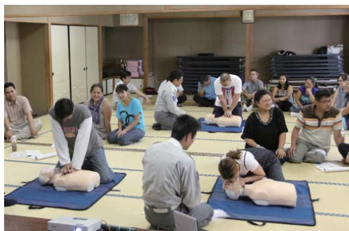
▼9月8日(日) 市民館 外国籍市民のための普通救命講習会

真岡の地産産野菜を使って地産地消に取り組もうと、ナス料理教室が開催され、ナスとひき肉入りのトルティーアと梅ドレッシングサラダ、ナシのコンポートを作りました。すてきなメニューが驚くほど手軽にでき、家族にも作ってあげたいと好評でした。