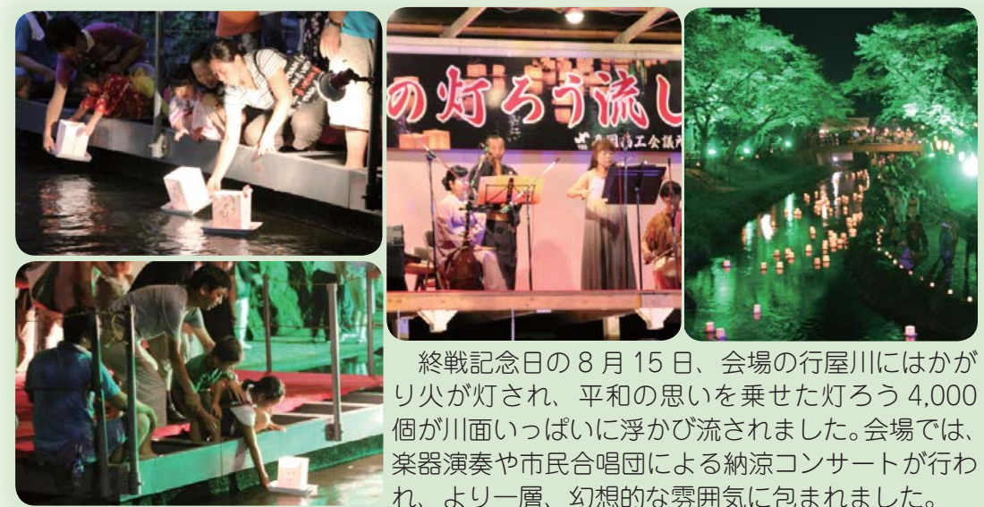
▼8月15日(木) 行屋川水辺公園 灯ろうに平和の願いをこめて 第19回真岡の灯ろう流し

郡市民総スポーツ推進の一環として、芳賀郡市内で毎年開催されるスポーツレクリエーション祭が、真岡市で行われました。各市町選抜チームによる交流試合や、チームライフルなどニュースポーツの体験も行われ、参加者は楽しんでプレーしていました。