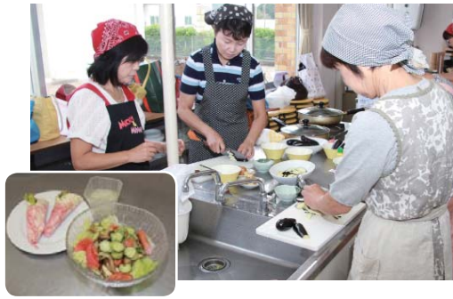
▼9月7日(土) 市民館 山前分館 市民講座 ナス料理教室