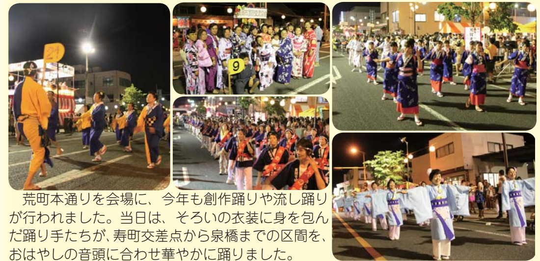
▼8月24日(土) 荒町本通り 夏の夜を華やかに舞う おおか木綿踊り

終戦記念日の8月15日、会場の行屋川にはかがり火が灯され、平和の思いを乗せた灯ろう4,000個が川面いっぱいに浮かび流されました。会場では、楽器演奏や市民合唱団による納涼コンサートが行われ、より一層、幻想的な雰囲気に包まれました。