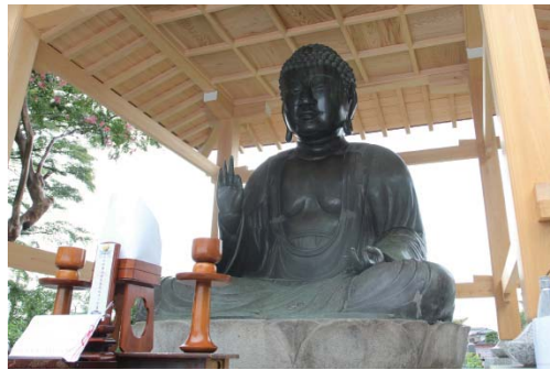
▼9月5日(木) 芳全寺 芳全寺阿弥陀如来坐像修復完了

ディンプルアートとは、特殊な絵の具を使ったカラフルなアートで、プラスチック板に塗り乾かすと、透明感のあるさざ波模様が現れ、スタンドグラスのような仕上がりになります。参加者たちは、夏休みの思い出となる作品が出来たとうれしそうでした。