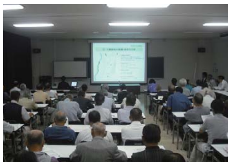
▲地域別懇談会の様子

今後は、地域別懇談会での意見等を踏まえ、都市計画マスタープランの素案を固めたのち、パブリックコメントを経て、平成26年3月の完成を目指します。