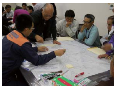
▲災害図上訓練の様子 ▲さまざまな被害想定が描かれた

今回の訓練で、物部地区の現状を確認し、災害が発生した際、どのように行動したらよいかを参加者全員が理解し、防災への意識を高めました。