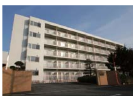
現在のコマツ旧真岡工場独身寮▶

市営住宅等として改修したコマツ旧真岡工場独身寮を取得し、子どもから高齢者まで、市民誰もが利用できる複合施設として活用します。