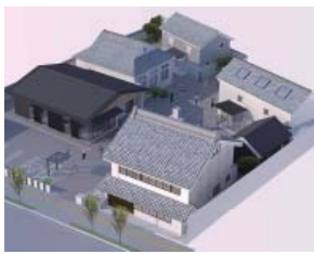
〔仮称〕久保記念観光文化交流館完成イメージ図▶