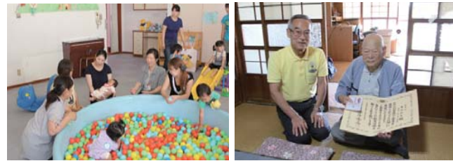
▲子育て支援センターの様子 ▲敬老祝金贈呈