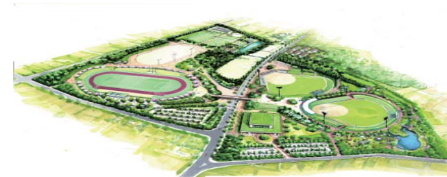
▲総合運動公園の基本計画イメージ図

総合運動公園整備事業 …… 2 億 9,348 万円 北ブロックの整備を推進するため、平成 26 年度と平成 27 年度の 2 カ年継続事業として、多目的広場周辺整備を行います。