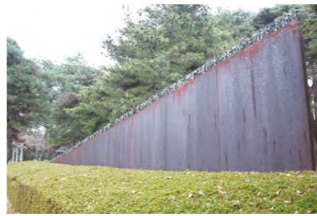
▲工業団地誘致を記念したモニュメントが、工業団地内の公園に立っている

携帯電話・IP 電話からは ☎ 03-3839-5212 通話料のみお客さま負担 体の症状・治療や育児、介護、ストレスなどの健康相談サービス