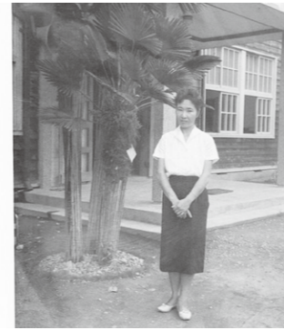
▶旧長沼北小学校の前で

私は、宇都宮の師範学校を卒業して、昭和18年に小学校の教師になりました。その頃は戦争で教師も徴兵されるようになり、教師の数も足りない時代でした。現在の塩谷町玉生にあった小学校の本校が最初の赴任先でしたが、昭和20年4月からは、実家近くの長沼北小学校で勤務することになりました。