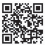
▲ 予防接種ナビ QRコード

下記QRコードまたは左記アドレスにアクセスし、お子さんの生年月日や名前、これまでの予防接種履歴を入力します。その後自動的にスケジュールが作成され、今後の予防接種の予定が確認できます。