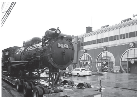
▲ 真岡駅に到着したD 51(ボイラー部分)

「S」の走るまち」のさらなるイメージアップのため、今年度、「D51形SL運搬・設置整備事業」を行っています。 静岡市から譲渡された蒸気機関車D51形SLは、3つに分割された状態で、9月17日に真岡駅東口に到着しました。