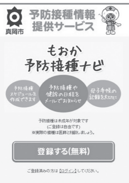
▲ 予防接種ナビの登録画面

※作成されたスケジュールはあくまでも目安です。当日の体調やかかりつけ医の診察のものと、正しく接種を受けましょう。