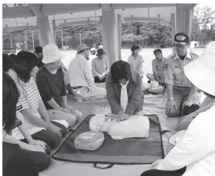
▲ 根本地区で開催された防災避難訓練

日本全国で、地震や台風、大雨などの自然災害が多発しています。風水害や予期せぬ自然災害から身を守るため、防災マップで地域の避難場所や安全な避難経路を確認するなど、日頃からの備えが大切です。また、防災訓練に参加し、市民一人一人、そして地域全体が防災に対する意識を高めることが大切です。