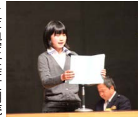
▶交通安全作文朗読

1月26日(木)、市民会館大ホールで、交通安全市民大会が開催されました。この大会は、市民の交通安全に対する意識を高め、より一層の普及を図ることを目的としています。