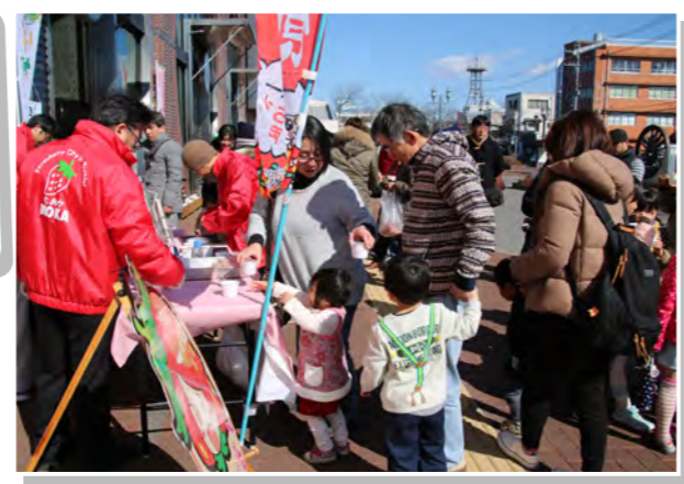
「いい芳賀いちご夢街道」の企画で、いちごSLが運行され、車内や真岡駅、茂木駅で、いちごの販売やイベントが開催されました。