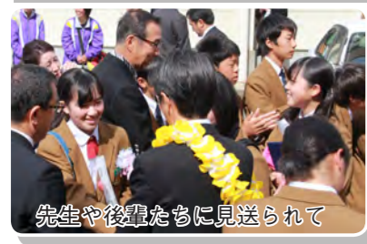
先生や後輩たちに見送られて