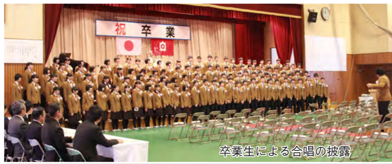
卒業生による合唱の披露