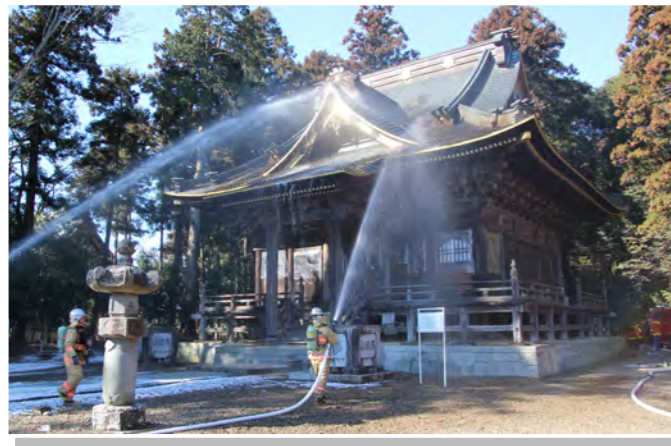
高田山専修寺で、檀家の方や地元消防団など約100人が参加し、文化財保護を目的とした防火訓練が行われました。

投票日当日に、仕事やレジャーなどで投票区内に居ない予定の方は、期日前投票ができます。投票所入場券裏面の「期日前投票宣誓書兼請求書」をあらかじめ記入してお持ちください。