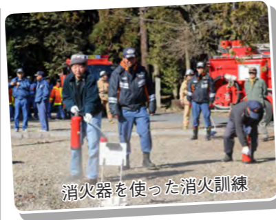
火の取り扱いには十分ご注意ください。