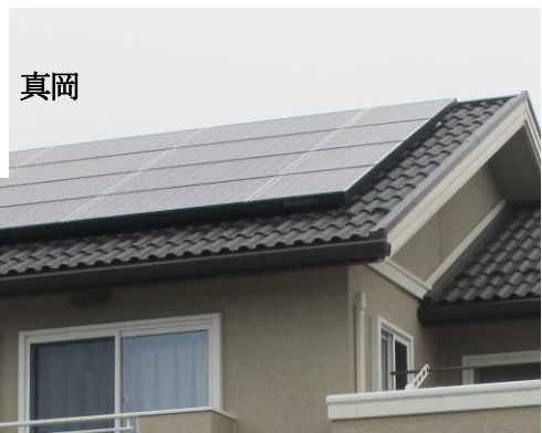
住宅用太陽光発電システム設置補助金