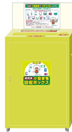
使用済小型家電のボックス回収