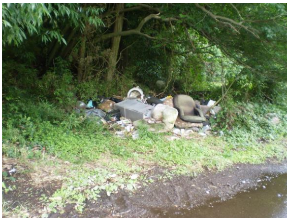
不法投棄監視パトロールの実施

☛ 平成 28 年 3 月に策定した第 2 次環境基本計画において、グリーン購入の推進について明記しています。