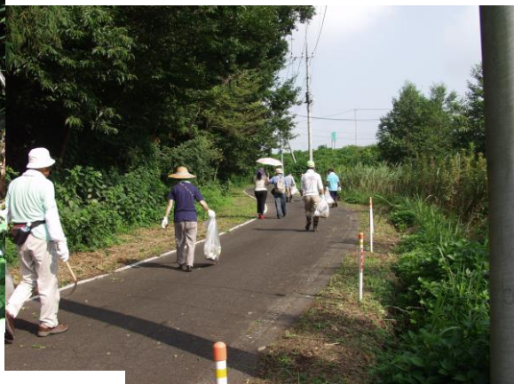
市民によるゴミ拾い