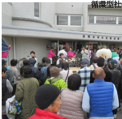
リサイクル品の抽選会