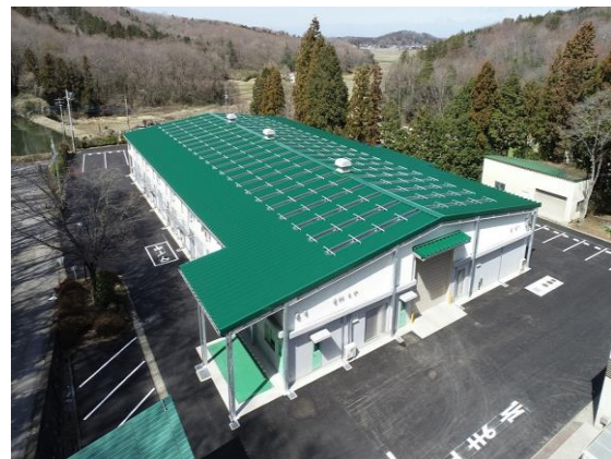
稼働開始した真岡市リサイクルセンター