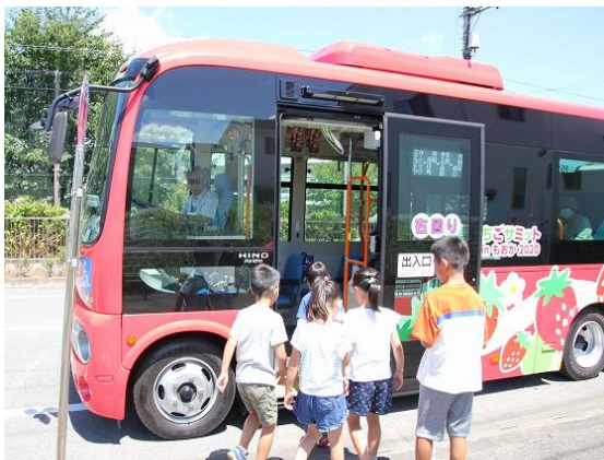
小学生対象いちごバス無料乗車キャンペーン

・その他 ☛ 温室効果ガス排出量削減のため、国民運動「COOL CHOICE (=賢い選択)」に賛同し、とちぎの豊かな環境と安心して暮らせる社会を次の世代に引き継ぐため、オールとちぎ体制で地球温暖化対策を推進する「COOL CHOICE とちぎ」県民運動への共同宣言に参画しています。