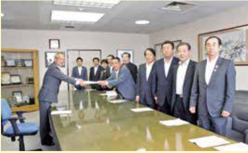
真政クラブ・公明