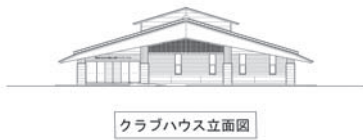
クラブハウス立立面図

答 近的10人立ちの弓道場の整備を予定している。現在の真岡市弓道場が5人立ちであり、整備する予定の弓道場では、その2倍の人数が利用できる施設を予定している。