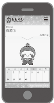
ごみ・資源分別アプリ

議案第74号 平成27年度真岡市後期高齢者医療特別会計補正予算 歳入歳出それぞれ425万4千円を追加し、予算総額を6億3128万円とするもので、歳出の内容は、後期高齢者医療広域連合納付金を補正するものです。