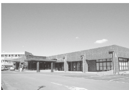
真岡市総合福祉保健センター (芳賀地区障害児者相談支援センターが設置されている。)

歳入歳出それぞれ425万4千円を追加し、予算総額を6億3128万円とするもので、歳出の内容は、後期高齢者医療広域連合納付金を補正するものです。