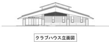
クラブハウス立立面図

答 近的10人立ちの弓道場の整備を予定している。現在の真岡市弓道場が5人立ちであり、整備する予定の弓道場では、その2倍の人数が利用できる施設を予定している。