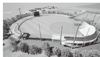
総合運動公園野球場イメージ図