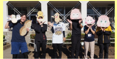
運動会（リレーの職員チーム）