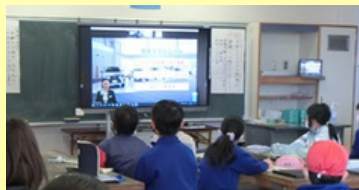
リモート社会科見学