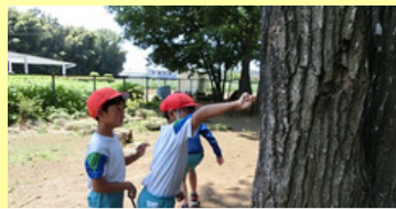
休み時間の学校林