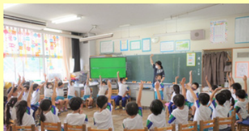
子どもが主体的に学ぶ授業

長田小学校は、“なかよく がんばる たのしい学校”を合い言葉に、ユニバーサルデザインの視点を取り入れながら、全ての児童が安心して過ごせる教室・学校・授業づくりに取り組んでいます。学校林「ぼくらの森・わたしたちの森」を保有し、生き物の観察、生活科や図工科の材料集め、落ち葉掃きなどを通して、自然を大切にすることを育てています。伝統的な取組である「花と緑と長田っ子活動」では、縦割り班ごとにヒマワリやマリーゴールドを種から育て、地域の「こども110番の家」の方に感謝の気持ちとともに苗を届けています。