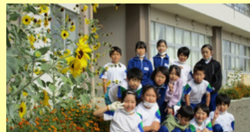
花と緑と長田っ子活動