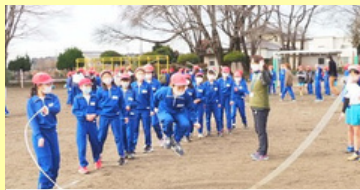
元気アップタイム（長田ぴょん）