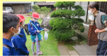
こども110番の家訪問