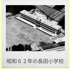
昭和62年の長田小学校

長田小学校は、“なかよく がんばる たのしい学校”を合い言葉に、ユニバーサルデザインの視点を取り入れながら、全ての児童が安心して過ごせる教室・学校・授業づくりに取り組んでいます。学校林「ぼくらの森・わたしたちの森」を保有し、生き物の観察、生活科や図工科の材料集め、落ち葉掃きなどを通して、自然を大切にすることを育てています。伝統的な取組である「花と緑と長田っ子活動」では、縦割り班ごとにヒマワリやマリーゴールドを種から育て、地域の「こども110番の家」の方に感謝の気持ちとともに苗を届けています。