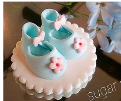
シュガークラフト（鑑賞用）