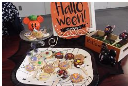
アイシングクッキー教室