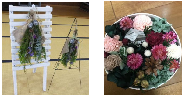
プリザーブドフラワーアレンジ