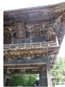
親鸞聖人ゆかりの 高田山専修寺を訪ねる