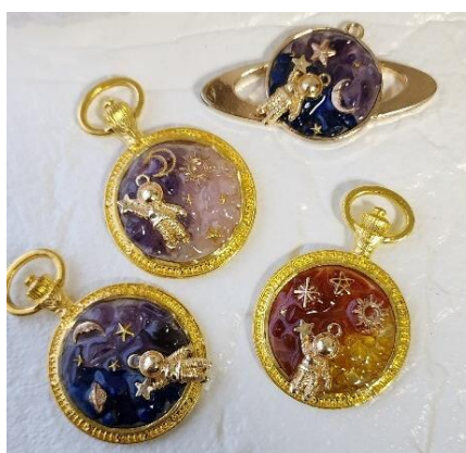
レジンキーホルダー