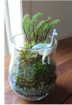
苔テラリウム作り