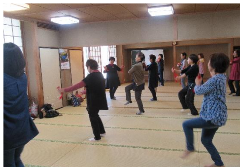
四つ竹健康おどり