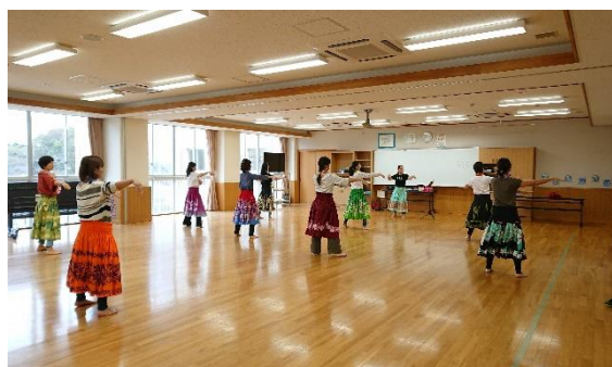
ハワイアンダンス・フラダンス