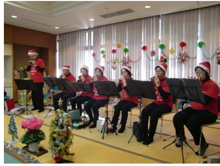
オカリナ演奏をきく