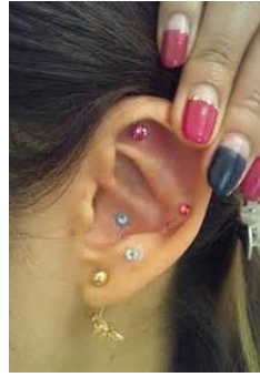
耳つぼジュエリー