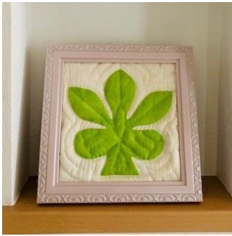
ハワイアンキルト ウルのアップリケ体験講座