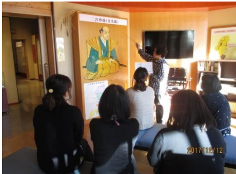
二宮金次郎の国指定史跡を訪ねる