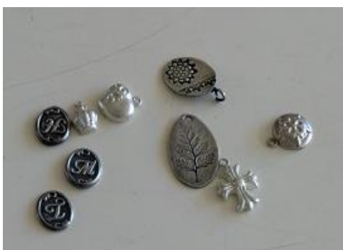
アートクレイシルバー