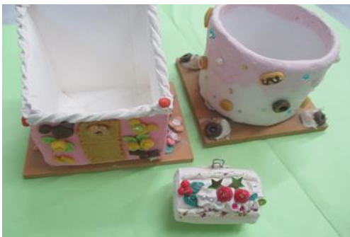
ミニチュアスイーツを粘土で作ろう