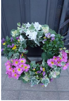
コンテナガーデニング