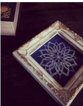
ピーコック曼荼羅ぬりえ®