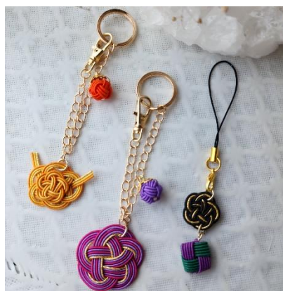
水引キーホルダー