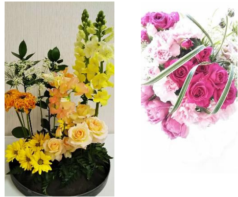
若返りのフラワーデザイン（生花）