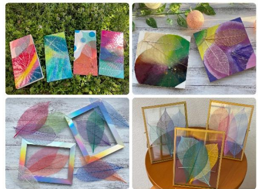
ボタニーペインティング