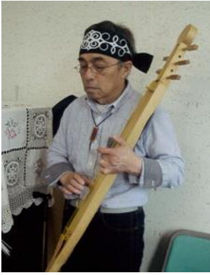
アイヌ音楽をきく