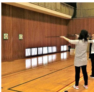
スポーツウェルネス吹矢