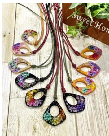
ウッドレジンペンダント