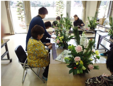
フラワーアレンジメント（生花）