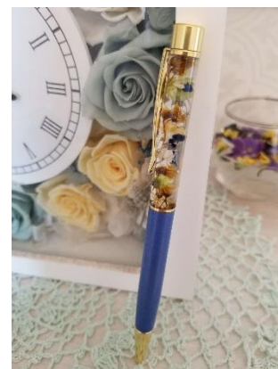
ハーバリウムボールペン