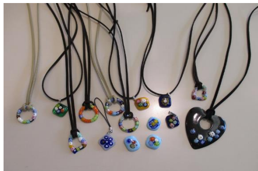
ヴェネチアガラスフュージング