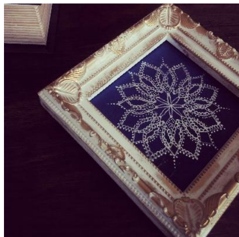
【ピーコック曼荼羅ぬりえ®】