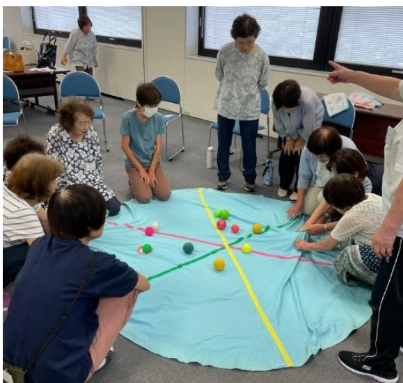
【認知症予防ゲーム】 .....