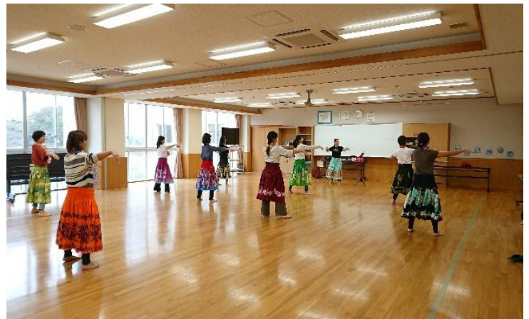
【ハワイアンダンス・フラダンス】