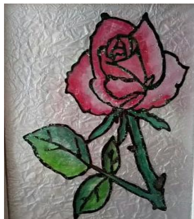
【パステルステンドグラスアート】