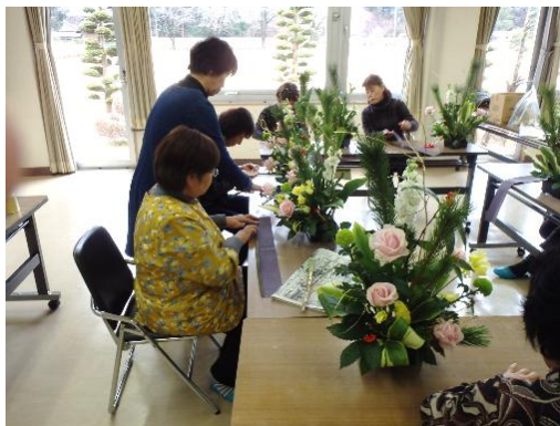
【フラワーアレンジメント（生花）】