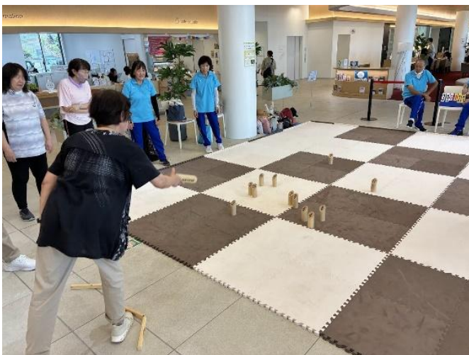
【ニュースポーツの広場】 .....