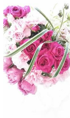
【プリザーブドフラワーアレンジ】 .....