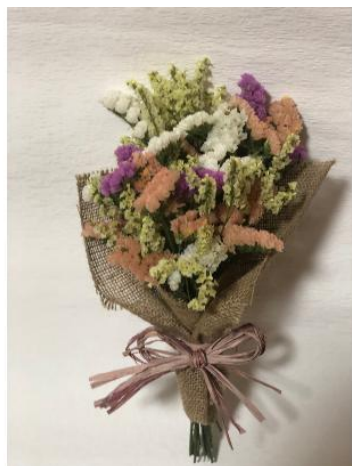
【お部屋を飾るドライフラワーの スワッグ教室】