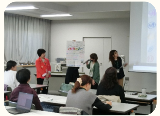
昨年度の研修の様子