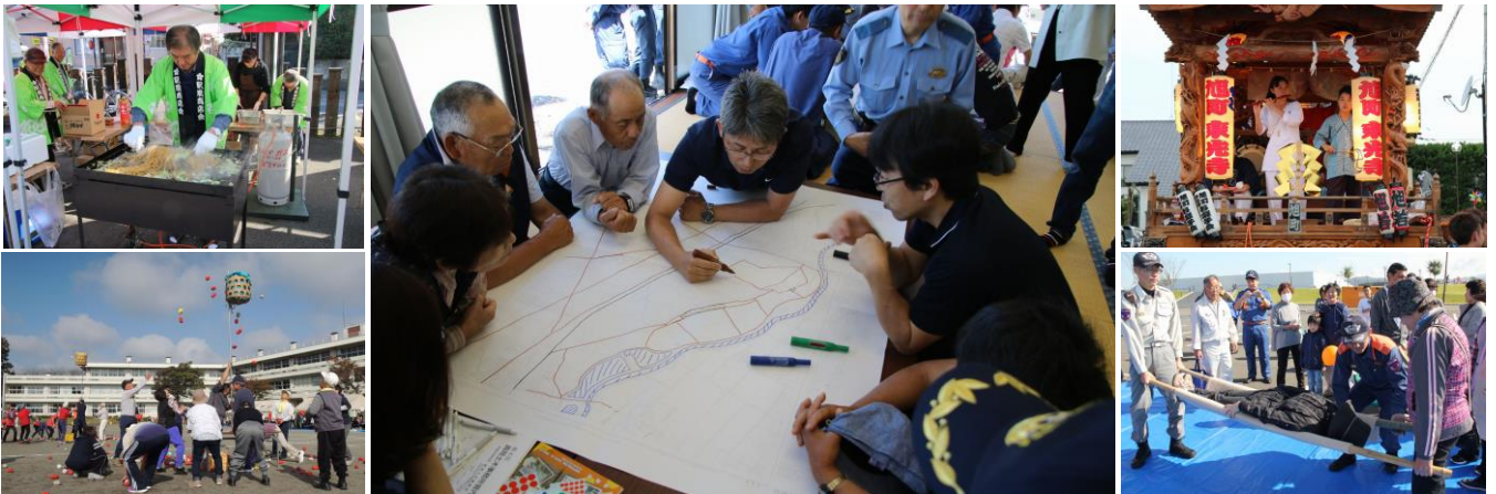
自治会活動の様子