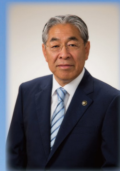
真岡市長 石坂 真一

私たちと一緒に希望に満ちた真岡市の未来を創造していきませんか。皆さんとともに働ける日を楽しみにしています。