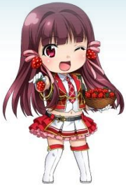
真岡市いちごチアリーダー 春崎 野乃花