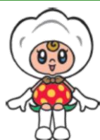
真岡市イメージキャラクター

栃木県の南東部に位置し、東に連なる八溝山地、西に流れる鬼怒川を抱える自然豊かな都市です。