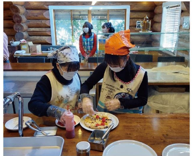
真岡市産の野菜をPRするために上三川町でピザづくり体験を開催