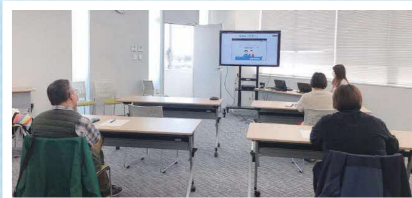
リモート受講のようす