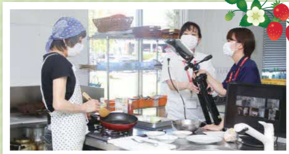
リモート料理教室のようす

その名のとおり、お父さんが作るごはんのこと。内閣府が実施しているキャンペーンで、男性の料理参画の促進を目的としています。男性の料理参画の第一歩として、簡単で手間をかけず、多少見た目が悪くてもおいしい料理を「おとう飯(はん)」と名付けました。家事はみんなでする時代!