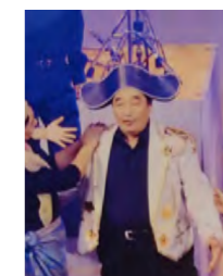
▲市民合唱団にて演目「カルメン」

定年後は、市民合唱団やウクレレのチームに所属し活動をしてきました。他にもイチゴ農家でアルバイトをしたり、温泉へ行ったり運動をしたりと、充実した日々でした。ところが、昨年の市制施行 70 周年記念事業の「第九」の練習終わりに転倒し、骨折してしまいました。合唱団の仲間たちのおかげで何とか助かりましたが、入院したことで病気もみつき、入退院を繰り返したため、結局「第九」の