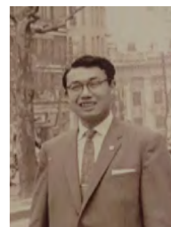
▲化粧品会社に勤めていたころ

追浜工場へ転職しました。その後、新工場が建設された上三川へ移ったのが 32 歳の頃です。それから 3 年後、上下水道が整備された真岡に魅力を感じて、八木岡に家を建てました。