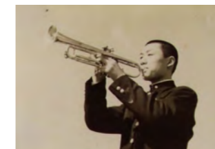
▲高校時代は brass バンド部でトランペットを担当

その後小学 4 年生から高校を卒業するまで、北海道で平穏に生活しました。高校の修学旅行で大阪へ行った際、活気あふれる街に惹かれ大阪の大学へ入学しました。大学を出た後は化粧品会社やホテル業に就き、転職のため北海道から九州まで、あちこちを回りました。しかし、家族との時間が取れないことに悩み、(株)日産の