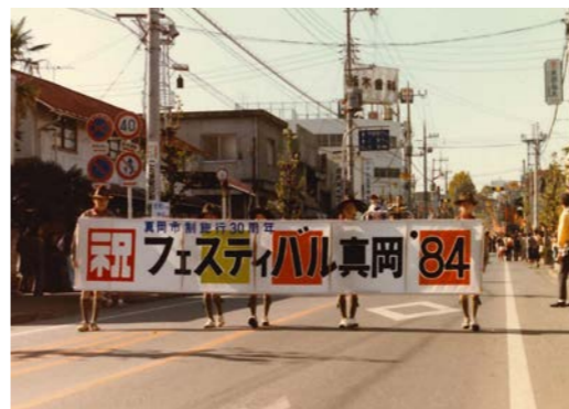
市民約3千人が練り歩いた大パレード