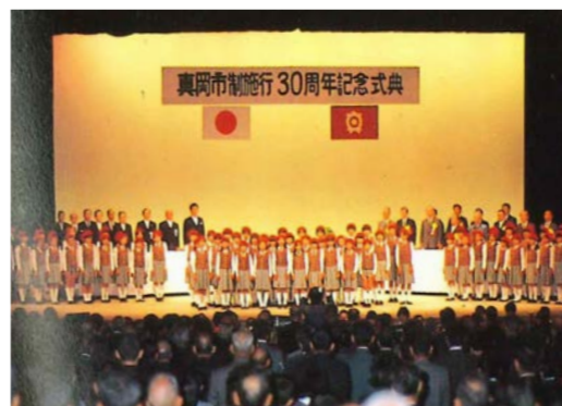
市民も参加して行われた30周年記念式典

昭和29年10月1日、真岡市が誕生しました。その後、工業団地の造成や区画整理による住宅地の整備が進められ、人口の増加とともに小・中学校や図書館の建設が相次ぐなど、真岡のまち並みは発展し続けてきました。そして、市制施行30周年を迎えた昭和59年、ひとつの節目として、さまざまな記念行事が企画されました。 記念行事の一つ、「フェスティバルもおか'84」では、「過去を振り返り、現在を見つめ、未来を考える」をテーマに、約3千人が大通りを練り歩く大パレードが行われました。県警音楽隊、小・中学生のブラスバンドや鼓笛隊、ミス真岡、歴代市長、流し踊り、地域のみこしや屋台、おはやしなど、パレードは先頭の田町交差点から真岡中学校の入口付近まで1500メートルもの長さでした。メイン会場の市民公園では、先頭が到着してから全員がそろって3時間ほどかかったそうです。 また、この大パレードに前後して、市民会館では30周年記念式典や市民コンサート、井頭公園では第1回真岡井頭マラソン大会、スケートセンターのオープンなどが続き、いずれの会場も大勢の人であふれ、郷土の30周年を盛大にお祝いしたそうです。 現在、市として誕生して68年。これからも、歴史と伝統を守りながら、誰もが暮らしやすく、住みたいと思えるまちづくりを市民とともに進め、100周年にはどんなまちの姿になっているのか楽しみですね。