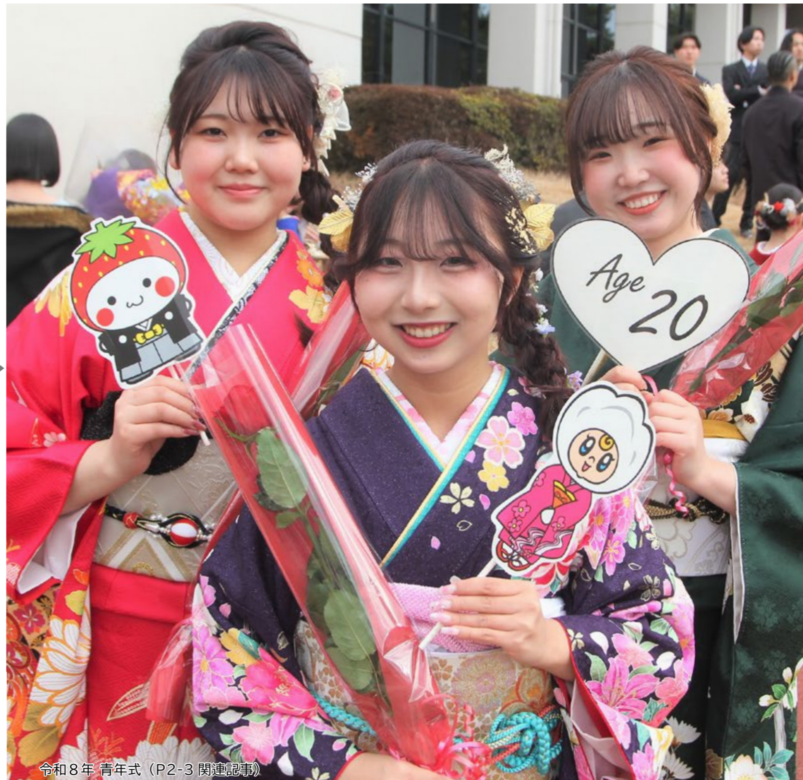
令和8年 青年式 (P2-3 関連記事)

〒321-4395 栃木県真岡市荒町 5191 / TEL 0285-83-8100 / FAX 0285-83-5896 / HP https://www.city.moka.lg.jp/