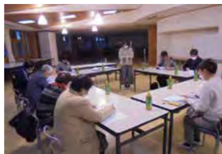
学校運営協議会の様子