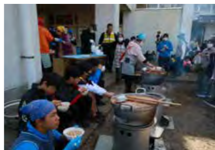
保護者や地域住民等による支援活動 (中村中学校区での防災キャンプの様子)