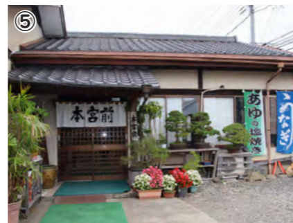
①天然うな重 ②天然鮎の塩焼き ③店内の様子 ④店主(左)と奥さん(右) ⑤店舗外観