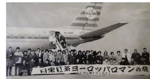
▲日東紅茶のクイズに当選して行ったヨーロッパ周遊ツアー(昭和46年ごろ)

その後、結婚して真岡へ嫁ぎ、2 人の子どもにも恵まれ、家事・子育て・仕事と忙しくも充実した日々を過ごしていました。昭和 39 年 4 月、旅行目的でのパスポート取得が自由になるようになり、旅行好きの私も海外旅行への関心が高まっていました。私は思い切って家族へ海外旅行へ行きたいことを伝えると、家族は受け入れてくれて、初めて友人とハワイへ行きました。その時の