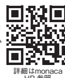
詳細は monaca HP 参照