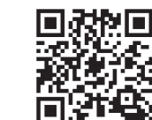
ももかっ子ひろば施設予約ページ