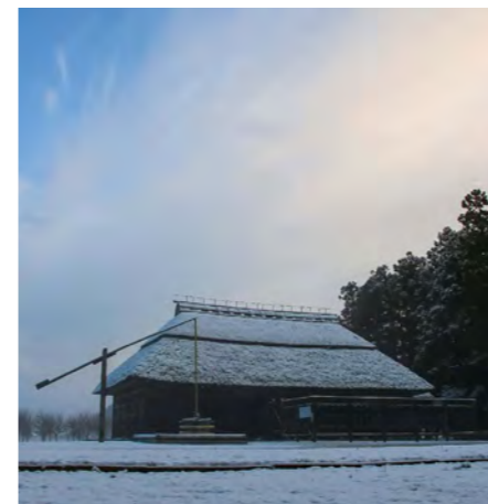
♡ Q▽ #桜町陣屋跡