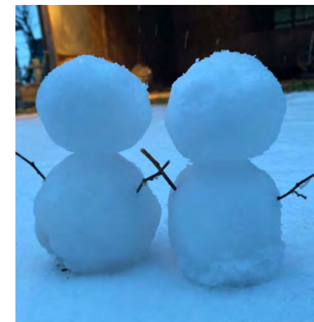
♡ Q▽ #雪だるま