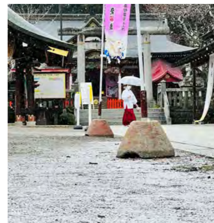
♡ Q▽ #大前神社