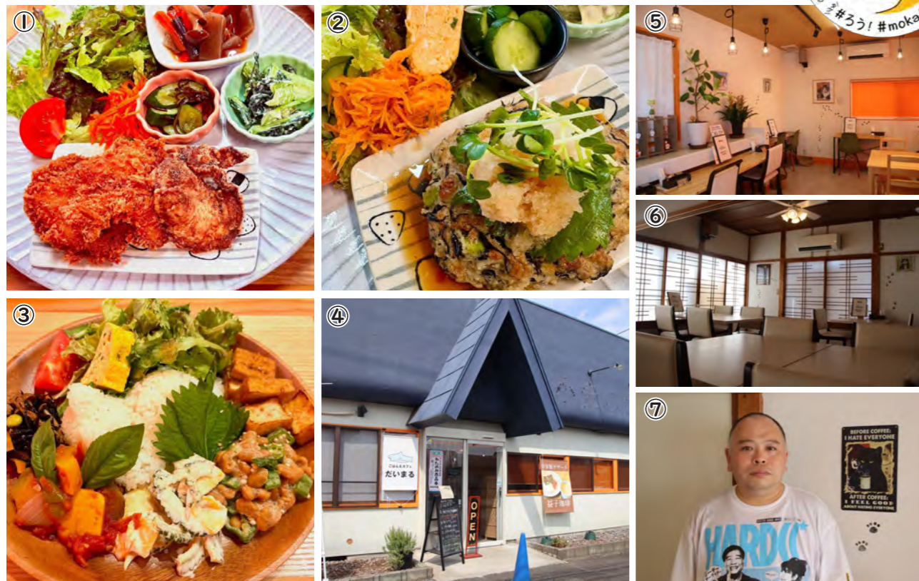
①さめフライとさめの唐揚げ ②豆腐ハンバーグ ③ブッダプレート ④店舗外観 ⑤⑥店内の様子 ⑦店主の服部健二さん

【所在地】西田井 1068-3 【電話】 88-0941 【駐車場】 14 台程度 【営業時間】 火～木曜日 10:30～17:00 金～日曜日 10:30～16:00 17:00～20:00 【定休日】 月曜日 ※臨時休業あり