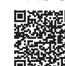
市HP ID 13648