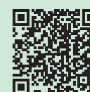
市HP ID 19784