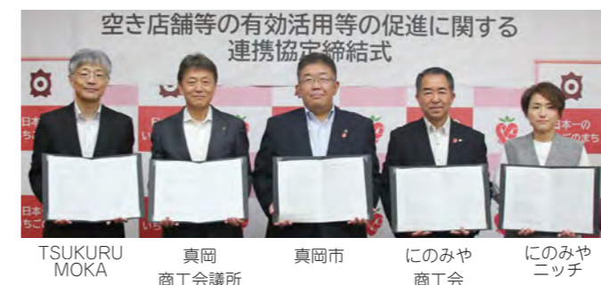
空店舗等の有効活用等の促進に関する連携協定締結式 TSUKURU MOKA 真岡 商工会議所 真岡市 にのみや 商工会 にのみや ニッチ

市は空き店舗等の有効活用を促進するために、市内で空き店舗等対策に関わっている4者と協定を結んでいます。協定に基づき、物件所有者と空き店舗等を探している人の相談窓口として情報を共有しながら、両者のマッチングを目指します。各団体へのご相談については市のホームページをご覧ください。