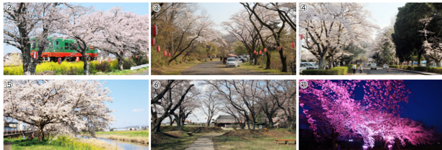
①行屋側水辺公園 ②北真岡駅周辺 ③根本山 ④井頭公園 ⑤五行川 ⑥桜町陣屋跡 ⑦Night Blossom(ナイトプロッサム)2026