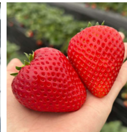
♡♡♡ #井頭観光いちご園