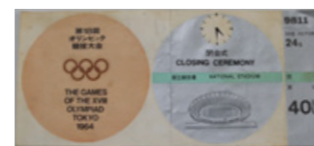
▲オリンピック閉会式の入場券

昭和 40 年ごろ、中村地区では大型の真岡工業団地の造成、そして大々的な水田の基盤整理事業が行われ、いちご栽培やプリンスメロン栽培が軌道に乗り始めました。