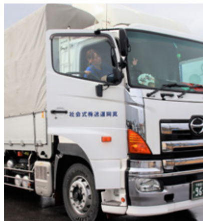
トラックに乗り込む様子