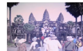
▲アンコールワット