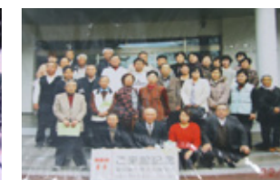
▲福島第一原子力発電所