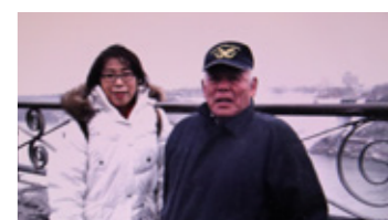
▲ナイアガラの滝の前で

ターへ、並ぶ五月女*から田植え機へ、平型乾燥から立体乾燥機の導入など、農業に画期的な変化が訪れました。