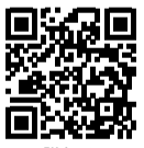
詳細は市HP参照 ID 24680

年金加入者ダイヤル Tel 0570-003-004 国保年金課国民年金係 Tel 81-3534 二宮支所 Tel 74-5004 宇都宮東年金事務所 Tel 028-683-3211