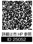
詳細は市HP参照 ID 25052