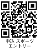
申込スポーツエントリー