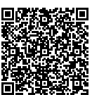
詳細は市HP参照 ID 24680