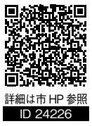
詳細は市HP参照 ID 24226