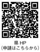
県HP (申請はこちらから)

※実施期間中は、対象地区以外でも受検できます 【検査時間】 午前10時～正午 午後1時～3時 【対象】 取引・証明用のはかりを所有している全ての事業者 ※今年度から、とちぎ電子申請システムでの事前申請および手数料の納付をしています。会場での現金払いはできません。電子申請の利用方法がわからない場合は、下記の連絡先までご連絡ください