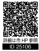
詳細は市HP参照 ID 25106

【とき】 10月19日(日) 午前10時～午後4時(予定) ※出演団体数によって変更になる可能性があります 【ところ】 KOBELCO 真岡いちごホール(市民会館)大ホール 【募集ジャンル】 ダンス(フラ、ハワイアン、よさこい、四つ竹、バレエ、ヒップホップ等)、音楽全般(演奏を伴うもの)、伝統芸能、朗読、民謡・民舞、吟詠剣詩舞、日本舞踊 【申込】 8月15日(金)までに「出演申込書」に必要事項を記入し、事務局(真岡市教育委員会文化課)へFAX、メール、窓口で受付 ※「出演申込書」は、文化課窓口・各公民館にて配布しています。市HPからもダウンロードできます。 ☎ 文化課文化振興係 Tel 83-7732