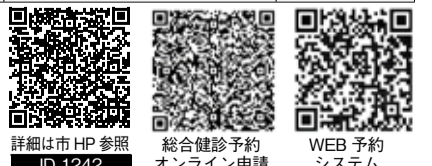
詳細は市HP参照 ID 1242 総合健診予約 オンライン申請 WEB予約システム

【申込】 健診日の2週間前までに下記へ電話または申込フォームで受付 ☎ 健康増進課健康づくり係 Tel 83-8122