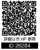
詳細は市HP参照 ID 26284